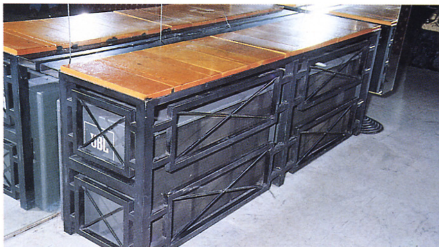
Le casse JBL mimetizzate all'interno dell'Atmosphere