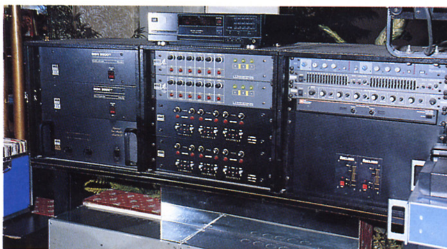
Parte della strumentazione dell'Atmosphere