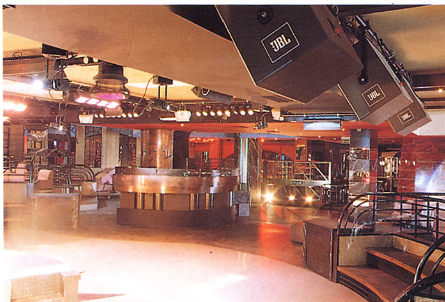
La pista del Cellophane

4716 A e due subwoofer triplacamera JBL Sound Power A series mod 4782 A. Elettroniche JBL-UREI, amplificatori BGW mod. 750F e 8500T. Equalizzatore RANE ME 15.